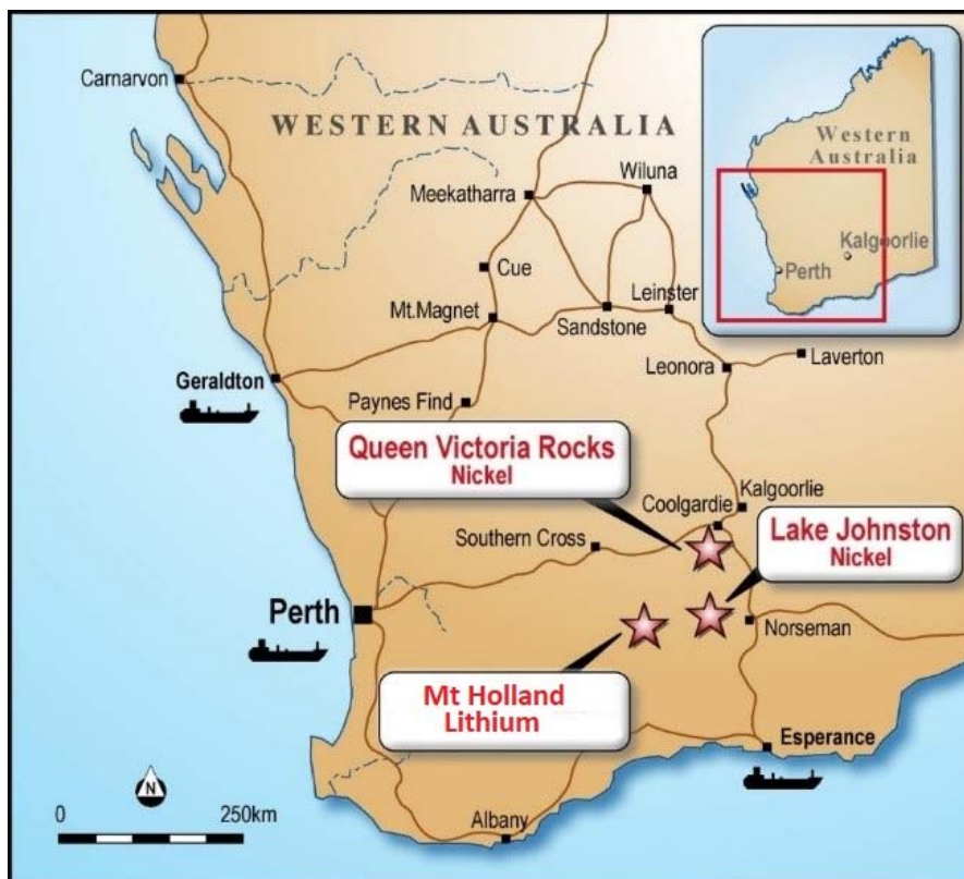
Figure 1: Location Map showing Hannans' Forrestania Project (adjacent to Mt Holland Lithium) and Queen Victoria Rocks Project and Lake Johnston Joint Venture Project (Hannans free-carried)

Mining Company Ltd. Zu den Aktionären haben seit Notierung an der Börse zu unterschiedlichen Zeiten unter anderm Rio Tinto, Anglo American, OM Holdings, Craton Capital und BlackRock gezählt. Weitere Informationen finden sie auf unserer Webseite www.hannansreward.com